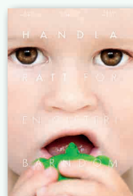
Boken "Handla rätt för en giftfri barndom" hjälper dig att leva mer miljösmartare i vardagen.

höga halter av kadmium. Undvik att slipa bort gammal färg om du är gravid. ▶ LÅT INTE DITT BARN suga på metallföremål, det kan finnas bly i billiga handväskor till exempel, vilket är giftiga för nerverna. ▶ TVÄTTA ALLTID NYA kläder och torka av plastleksaker ▶ KÖP MILJÖVÄNLIGA STÄD- och hygienprodukter, utan parfym.